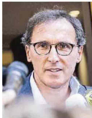
Il ministro Francesco Boccia

L'incontro "L'impresa e lo sviluppo sostenibile: sfide, prospettive e opportunità", organizzato da Confcommercio Veneto e Associazione Veneta per lo Sviluppo Sostenibile, con la partecipazione di Enrico Giovannini, portavo-