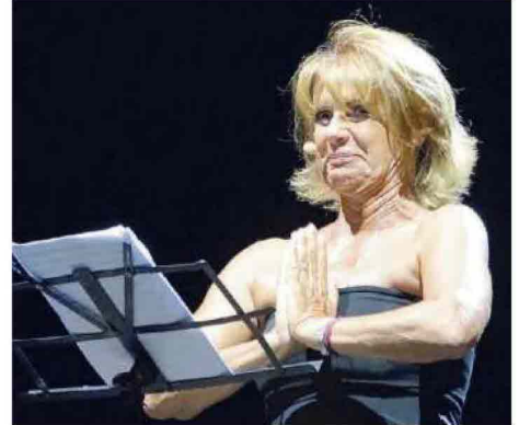
Lella Costa; a sinistra, l'Orchestra di Padova e del Veneto