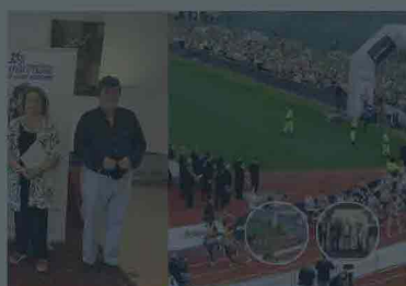
athon Padova Marathon 2019